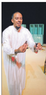
Zijn huwelijksleven draait uit op een ramp.