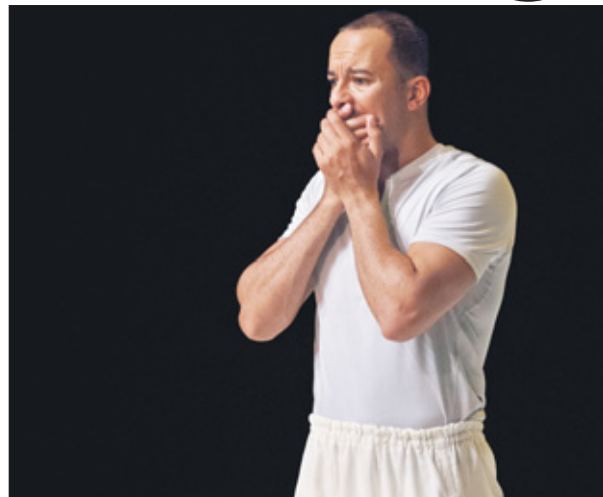
„Op dat moment veroorzaakt Larhzaoui's kwetsbaarheid kippenviel - en dan moet het emotionerende slot nog komen.“ (Recensie Het Parool)