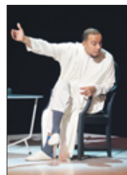
Het is een persoonlijk verhaal over zijn opvoeding en de verhouding met zijn Marokkaanse familie.