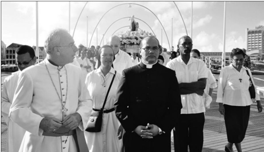
Het beeld van Santa Ana in de processie gistermorgen.