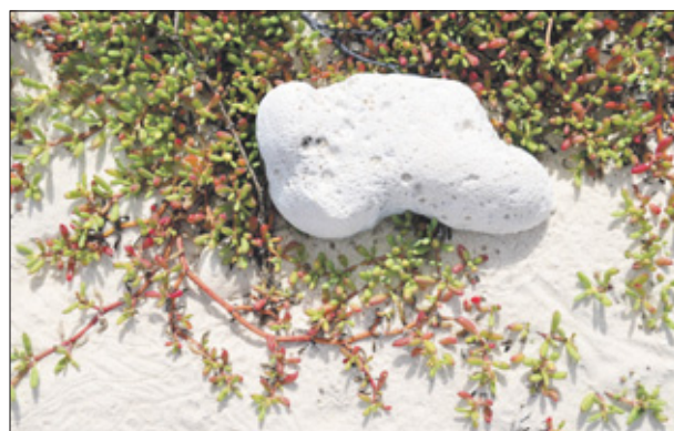
Er groeien voornamelijk kleine vetplantjes, bai bolbe bin.