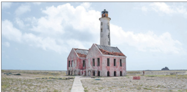
In het midden van het eiland staat de monumentale vuurtoren, die gebouwd is na de orkaan van 1877.