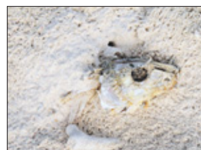
Een vis op het droge.

zuidelijke deel van het eiland. Er worden door lokale vissers graag sterke verhalen verteld, bijvoorbeeld over een visser die in de golven verdween en wiens geest nog over het eiland zou ronddwalen. Een ander fenomeen is de legende van een Engelse kapitein, die gestrand zou zijn in de 19e eeuw en op het eiland is overleden en begraven, maar dat zijn geest geen rust zou hebben gevonden en