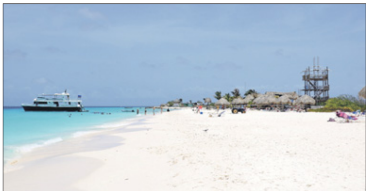
Het eindeloze witte zandstrand in combinatie met het turquoise gekleurde, kristalheldere water.