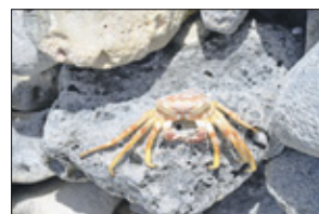
De krab heeft zijn omhulsel verlaten voor een nieuw onderkomen.