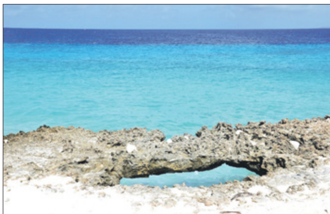
Mini natural bridge.