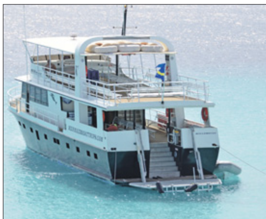
Dagelijks meren er boten aan met toeristen.