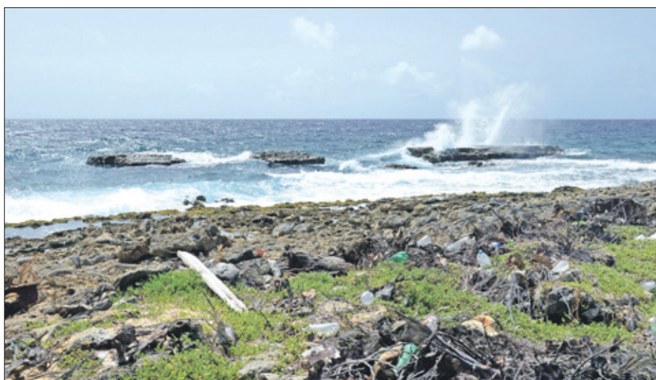
Ook veel plastic uit omliggende (ei)landen spoelt aan.