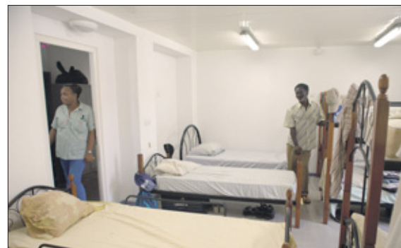
Een slaapkamer van de nachtopvang.