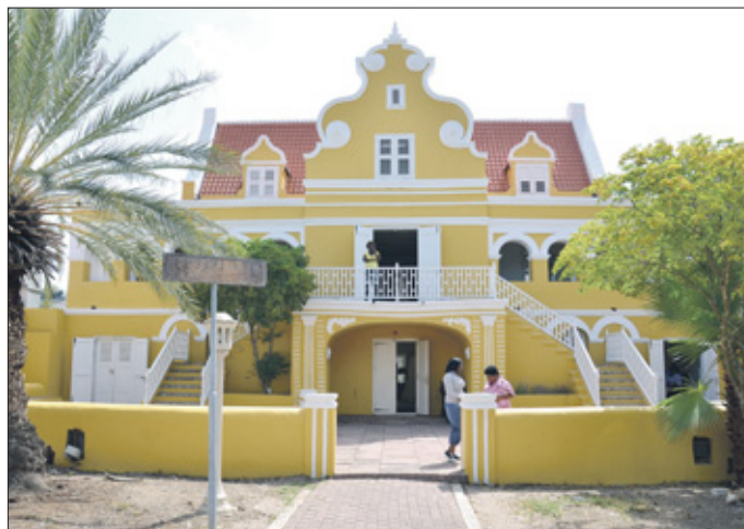
Het Pachi de Sola gebouw, oftewel Oud Kranshi op Scharloo waarin FMA sinds april dit jaar gehuisvest is.

re begeleid door FMA, door ervoor te zorgen dat er een ziektekostenverzekering voor hen geregeld is, of een uitkering, die voor hen te beheren en ervoor te zorgen dat niet alles van hen kan worden afgepakt. Indien nodig wordt er ook voor gezorgd dat er een arts bij gehaald wordt, minder. Ook worden de cliënten op allerlei mogelijke manie-