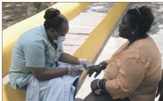
Nagelverzorging van een cliënt.