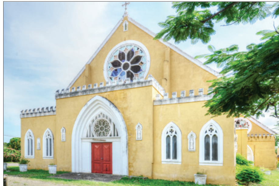
De imposante gotische voorkant van de kerk te Steenrijk.

Uit de kracht van de verschillende fasen uit deze goede tijden. 'Through all the changing scenes of life', zoals dat gezongen wordt in een mooie Anglicaanse lofzang, hoopt de Anglicaanse gemeenschap, met de nodige financiële hulp, een tweede leven aan het mooie kerkgebouw te Steenrijk te kunnen geven en doet een dringend beroep op eventuele sponsors. De kerk hoopt met de restauratie van het gebouw haar rol in de Curaçose gemeenschap in een nieuw perspectief te kunnen zien, als een venster naar God.