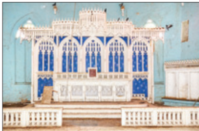
Het prachtige gotische altaar, dat er als enige in het vervallen kerkgebouw nog intact zit.

V an buitenaf is niet duidelijk te zien hoe groot het verval van het kerkgebouw is, maar eenmaal binnen word je ermee geconfronteerd. Er zijn grote gaten in het dak, waardoorheen de wacamaya's, van die grote gekleurde ara's, in en uit vliegen. Er leven op Curaçao niet veel wacamaya's vrij in de natuur en deze hebben dus een plekje gevonden in de kerk. 's Morgens gaan ze op pad en tegen schemer keren ze terug. Ook een grote duivenkolonie, die er zich heeft genesteld. Fladdert steeds op en neer vanuit de twee openstaande kasten die zich er nog bevinden. Ze bevinden zich echt overal in het kerkgebouw.