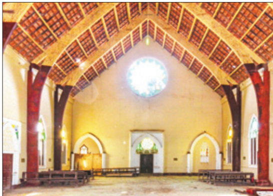
Beeld van de binnenkant achter in de kerk, met het hoge dak en de gaten hier en daar.