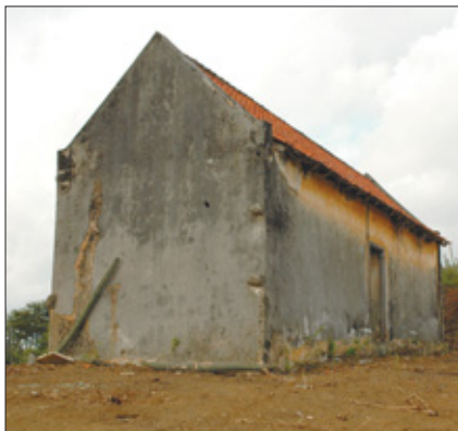
Het National Archaeological Anthropological Memory Management (NAAM) kan helpen bij de restauratie van het landhuis en andere archeologische vondsten.