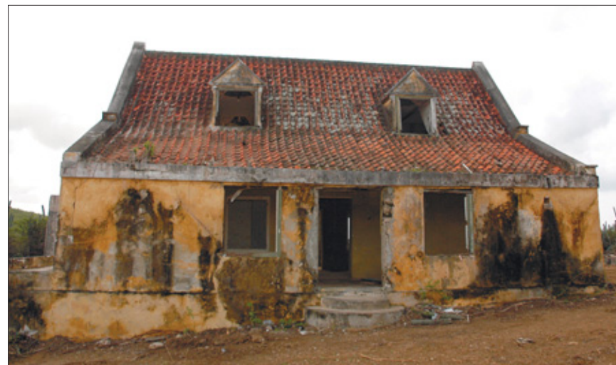
Het landhuis zoals het er nu bijstaat.