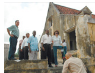
De pers krijgt een rondleiding op het schoongemaakte terrein waar de Fundashon Kas Popular gaat bouwen.