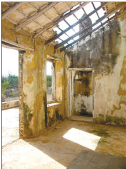
Het te ontwikkelen gebied loopt door tot Malpais.