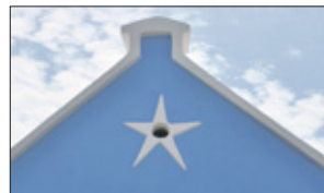
Gevels langs de snelweg.