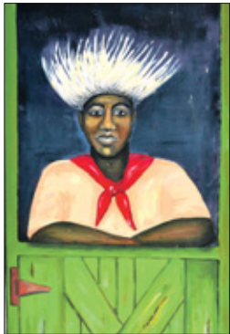
Kunst op het gebouw.