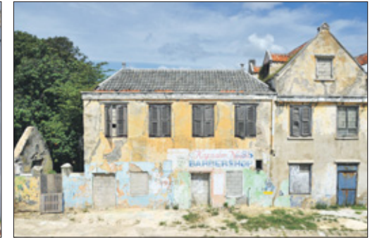
Het prachtige, leegstaande pand.