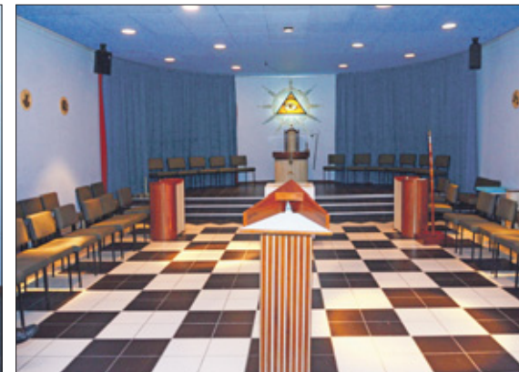
De werkplaats, de plek waar de leden van de drie Nederlandse loges op Curaçao samenkomen en werken.

In het kader van de vrijmetselarij wordt op zaterdag 10 september een open dag gehouden bij alle loges op Curaçao. Er zullen rondleidingen gegeven worden en er zal een panel van deskundigen aanwezig zijn, die bezoekers op alle mogelijke gestelde vragen zal antwoorden. Toen mij gevraagd werd om dit interview te doen, greep ik deze gelegenheid met beide handen aan. Een kijkje nemen binnen in de loge? Heel graag, want dit onderwerp intrigeert mij al heel lang.