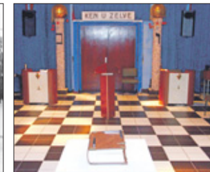
De in- en uitgang van de werkplaats.