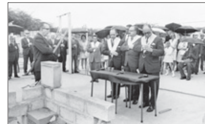
Rust en Burgh: Plaatsing van de hoeksteen van het huidige logegebouw (23 mei 1971).

De vrijmetselarij begon in 1785 op Curaçao in haar allereerste behuizing in Landhuis Kortijn in Otrobanda en bestaat al 230 jaar. De belangrijkste en bekendste plek echter is het logegebouw Wilhelminaplein: een van de gebouwen waar vrijmetselaren op Curaçao in het verleden hebben gearbeid. Tegenwoordig is in dit gebouw het Openbaar Ministerie (OM) gehuisvest (zie foto). Er werd geronde jaren van verschillende tussentijdse gebruikgemaakt, onder andere ook het gebouw van de Tempel. De allereerste loge, de oudste in het Caribisch gebied, werd op Sint Eustatius opgericht. Daarna kwam de loge van Suriname erbij, die onlangs het 250-jarig bestaan vierde.