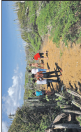
'Behind the scenes', de mode-shoot op Curaçao.