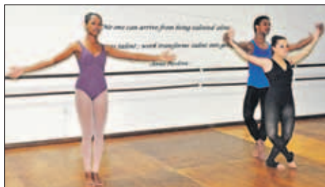
Om goed te worden moet er veel geoefend worden.