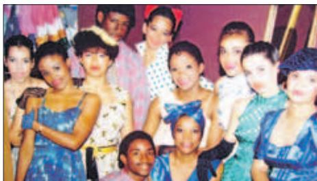
Ballet Contemporaneo uit de jaren '80.