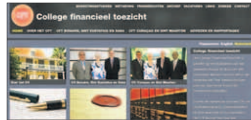
De vernieuwde website van de ARC en de website van het College financieel toezicht (Cf). Breedijk hoopt dat bij een eerstvolgende wijziging van de grondwet minstens de bepalingen in de oude staatsregeling weer in ere worden hersteld, waaronder de gewaarborgde onafhankelijkheid en de toezichtfunctie die nu overgenomen is door het CR. Het overvelven van deze taak naar het CR vindt Breedijk een rechtstreekse en onaanvaardbare aantasting van de interne autonomie en de onafhankelijkheid van het Curaçaoes parlement.

mede gebaseerd op een ingewonnen advies van een staatsrechtgeleerde. Dat is nu allemaal helemaal bijgewerkt. De rekenkamer is het centrale orgaan van de Staten. Onze rapporten brengen we uit aan de Staten. Alle statenleden krijgen elk een eigen exemplaar van het rapport, met hun naam erop. Meer dan tien jaar geleden hadden we op een gegeven moment een rapport uitgebracht, dat pas later in de publiciteit kwam en kennelijk een smoesjig onderwerp was voor het publiek. Enkele Statenleden belden naar de rekenkamer voor een exemplaar van het rapport. Hiermee ik wil aangeven dat ze niet alleen dat rapport niet hadden gelezen, maar dat ze niet eens wisten dat dat rapport reeds hadden ontvangen en dat het al geruime tijd in hun postbus lag. De laatste tijd is dit wel verbeterd, in zoverre dat er nog commotie was over enige rapporten die we hadden uitgebracht rond 10-10-10, waarbij bepaalde voormalige Eilandbestuurders zich aangesproken voelden en er in de kranten stond dat een van de rapporten voor de vuilnisbak bestemd was. Tevens moet ik constateren dat de rapporten die ik eind oktober 2012, vlak voor mijn aftreden, heb kunnen ondertekenen, nu na meer dan een half jaar, nog steeds niet in de Staten zijn behandeld. In 2006, vóór de ondertekening van de zogenoemde Slotverklaring, waren er stemmen die opgingen dat er een Koninkrijks-rekenkamer of een Begrotingskamer, of iets dergelijks zou moeten komen. Het College financieel toezicht (Cf) kent niemand nog. Reeds in september 2006