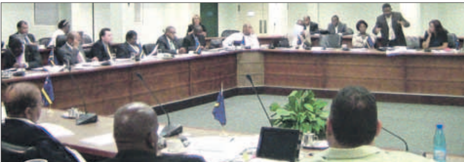
Statenleden krijgen elk een eigen exemplaar van rapporten van de ARC, op naam. De rapportages worden niet altijd goed gelezen en blijken soms maanden te blijven liggen in de postvakken van de Statenleden. Ook is het parlement traag in het behandelen van de bevindingen. De rapporten van eind oktober 2012 zijn nu, na meer dan een half jaar, nog steeds niet in de Staten behandeld.

mede gebaseerd op een ingewonnen advies van een staatsrechtgeleerde. Dat is nu allemaal helemaal bijgewerkt. De rekenkamer is het centrale orgaan van de Staten. Onze rapporten brengen we uit aan de Staten. Alle statenleden krijgen elk een eigen exemplaar van het rapport, met hun naam erop. Meer dan tien jaar geleden hadden we op een gegeven moment een rapport uitgebracht, dat pas later in de publiciteit kwam en kennelijk een smoesjig onderwerp was voor het publiek. Enkele Statenleden belden naar de rekenkamer voor een exemplaar van het rapport. Hiermee ik wil aangeven dat ze niet alleen dat rapport niet hadden gelezen, maar dat ze niet eens wisten dat dat rapport reeds hadden ontvangen en dat het al geruime tijd in hun postbus lag. De laatste tijd is dit wel verbeterd, in zoverre dat er nog commotie was over enige rapporten die we hadden uitgebracht rond 10-10-10, waarbij bepaalde voormalige Eilandbestuurders zich aangesproken voelden en er in de kranten stond dat een van de rapporten voor de vuilnisbak bestemd was. Tevens moet ik constateren dat de rapporten die ik eind oktober 2012, vlak voor mijn aftreden, heb kunnen ondertekenen, nu na meer dan een half jaar, nog steeds niet in de Staten zijn behandeld. In 2006, vóór de ondertekening van de zogenoemde Slotverklaring, waren er stemmen die opgingen dat er een Koninkrijks-rekenkamer of een Begrotingskamer, of iets dergelijks zou moeten komen. Het College financieel toezicht (Cf) kent niemand nog. Reeds in september 2006