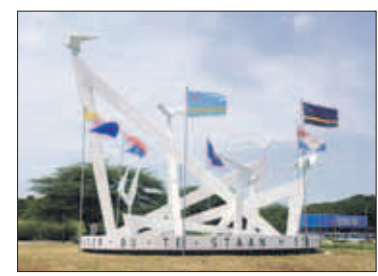
In de nieuwe wetgeving voor de rekenkamer van het Land Curaçao, is door de wetgever verzuimd een overgangsregeling op te nemen voor na 10 oktober 2010. De Kamer heeft toen zelfstandig besloten de werkzaamheden voor de andere eilanden af te ronden.