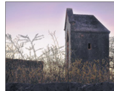
Huisje op weg naar het fort.