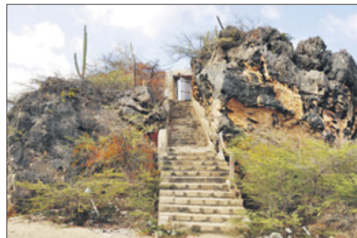
Trap naar fort Beekenburg.