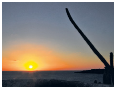
Schitterende zonsopgang vanaf het fort.