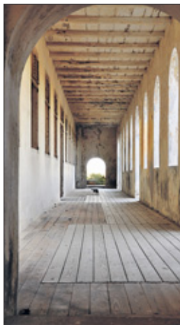
Het vervallen Quarantainegebouw is een dankbaar object voor fotografen.