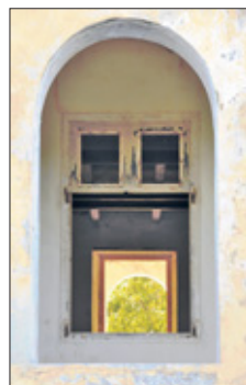
Details van het Quarantainegebouw.