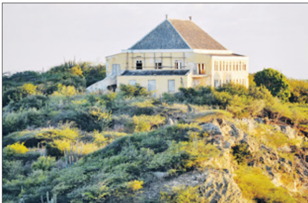
Het hogerop gelegen Quarantainegebouw.