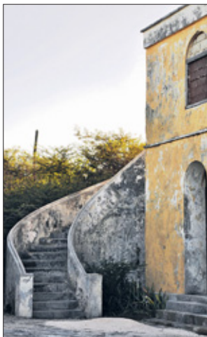
Fraaie trap aan de zijkant van het gebouw.