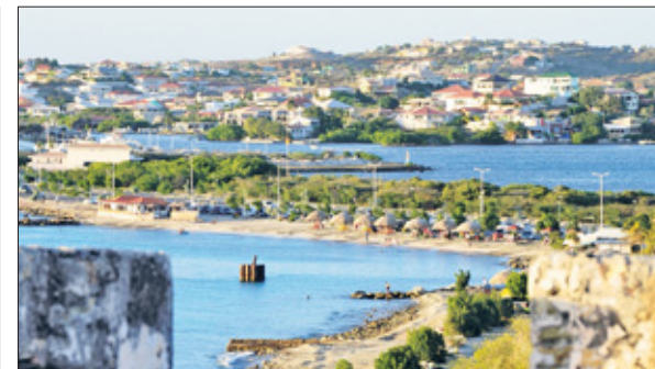
Uitzicht op de Caracasbaai en het Spaanse water.

Schepen waarop de gele koorts heerste, die als een van de meest besmettelijke ziektes uit die tijd gold, waren herkenbaar aan een gele vlag, die verplicht gevoerd moest worden. De zieke mensen werden ondergebracht in het voormalig kazernesgebouw van Fort Beekenburg, dat tot quarantainehospitaal werd omgebouwd. Daarna geschiedde er in 1883 een uitbreiding met wat we nu kennen als het Quarantainegebouw. De zieken moesten er 40 dagen verblijven, de goederen op de schepen werden uitgerookt om bacteriën te doden.