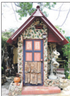
Een 'tiny library' in de tuin.