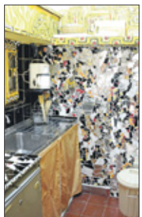
Appartementen van binnen ook kunstig ingericht.