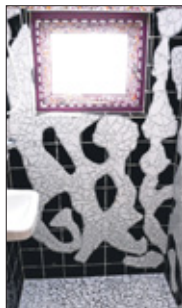
Kunst tot in de douche.