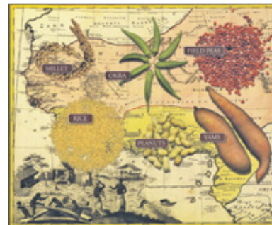
Overzicht van het voedsel uit Afrika zoals gierst, okra (yambo), rijst, bonen, pinda's en yams.