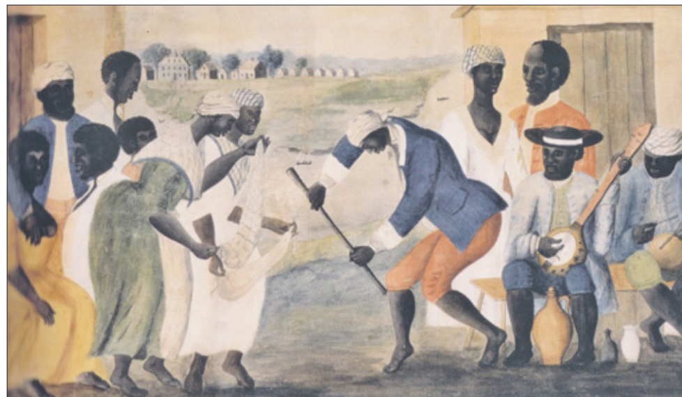
Slaven vieren een feestdag op de plantage Middleton. Musici bespelen een 'qudugulu', een kleine trommel en een 'molo' (banjo), beide uit de streek Yoruba. De vrouwen dansen op de muziek.

Tussen de 15de en 16de eeuw dreeven de West-Afrikanen handel met de Europeanen. De Europeanen leverden voedsel, alcohol, ijzer, koper en brons en vooral wapens en kruit. Andere handelsproducten uit Europa waren witte suiker, zilveren bellen, Turkse tapijten, specerijen, vishaken, naalden en spelden. West-Afrikanen op hun beurt leverden ivoor, goud, huiden, peper maar soms ook krijgsgevangenen die verkocht werden als slaven. Alhoewel de Afrikanen al slavernij bedreven, was hun manier heel anders dan de Europese. De Europeanen vervoerden hun slaven op afschuwelijke wijze over de Atlantische