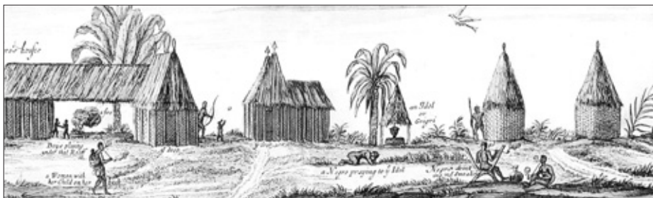
Een dorp uit Senegal in de zeventiende eeuw met een bijeenkomstplaats, een kerker (?), een overdekte waterput en hutten gemaakt van geweven bladeren.