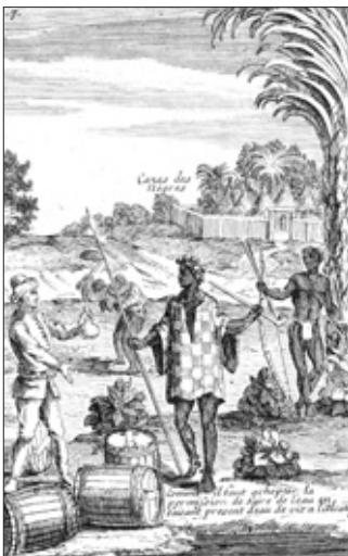
Europeanen onderhandelen aan de kust met gewelgestelde Afrikanen en ruilen producten als alcohol en voedsel, maar ook slaven, zoals te zien op deze prent uit de zeventiende eeuw.

Aan het begin van de twintigste eeuw woonden veel zwarte families, afstammelingen van slaven uit West Afrika, aan de rivier Ashley in South Carolina. Er was een grote rijstplantage gevestigd met de naam Middleton Place.