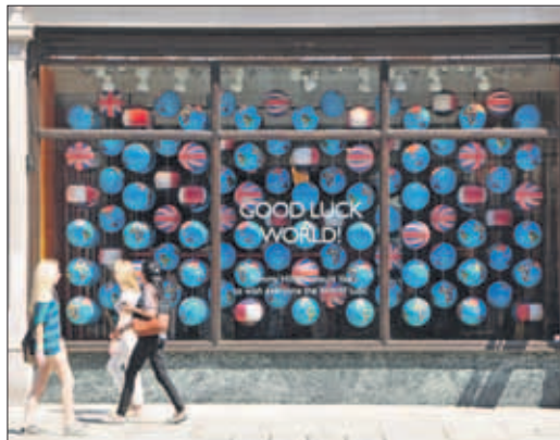
Etalages in de winkelstraten in hartje Londen staan allemaal in het teken van de Spelen.