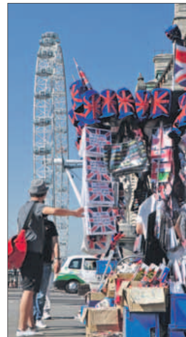
Souvenirshops met allerhande herinneringen aan de Spelen.

met een symfonisch orkest een ode te brengen aan filmmuziek, zat Mr. Bean aan de synthesizer. Daar zijn instrumentenpartij in 'Chariots of Fire' slechts één noot bevat, slaat de verveling snel toe, hij droomt weg en komt terecht op het strand waar hij naar analogie van de film meeloopt met andere deelnemers. In de loopwedstrijd verslaat Bean de grootste Britse sporthelden, al is het op zijn eigen typische manier. Het humoristisch intermezzo viel in de smaak en Rowan Atkinson kreeg een daverend applaus van de 80.000 toeschouwers. In het park bij London Eye worden de toeschouwers vermaakt.