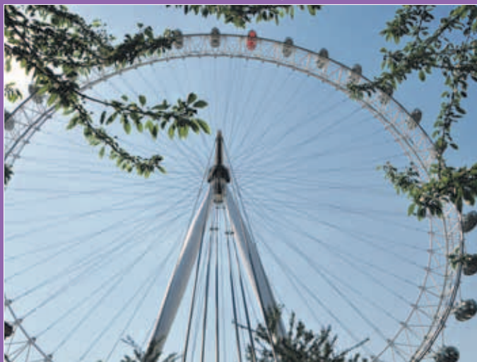
London Eye, een reuzenrad in Londen, aan de zuidelijke oever van de rivier Theems, tegenover het Palace of Westminster. Het London Eye is gebouwd in opdracht van British Airways, ter gelegenheid van de millenniumwisseling in 2000 en wordt daarom ook wel het Millennium Wheel genoemd. Het is 135 meter hoog, weegt 1.700 ton en heeft 32 gesloten capsules. Een ritje in het reuzenrad duurt 30 minuten (gemiddelde snelheid: 0,26 m/s) en biedt een ruim uitzicht op Londen en het landschap daaromheen. Het rad draait zo langzaam dat het voor in- en uitstappen van de passagiers niet stilgezet hoeft te worden. Bovenin kan men bij helder weer 7 graafschappen, 3 luchthavens, 13 voetbalstadions en 36 bruggen over de Theems zien. Het London Eye is het op drie na hoogste bouwwerk van Londen en draait per jaar ongeveer 6.000 keer rond.

Londen is van 27 juli tot en met 12 augustus het toneel van de Olympische Spelen, die voor het eerst in 1896 werden georganiseerd. Londen is de eerste stad, die voor de derde keer de Spelen mag organiseren. Eerder vonden de Spelen van 1908 en 1948 er plaats.