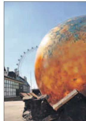
De straten in de hoofdstad, maar ook overal in het land, zijn versierd met vlaggetjes van de deelnemende landen.