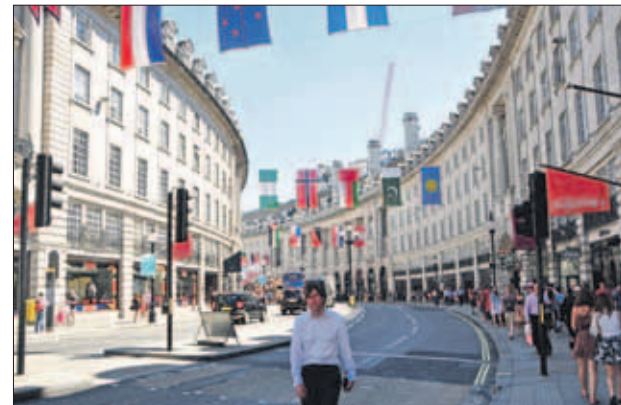
De straten in de hoofdstad, maar ook overal in het land, zijn versierd met vlaggetjes van de deelnemende landen.