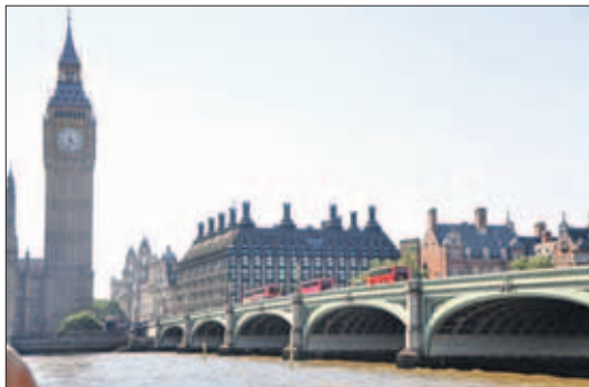
Westminster Bridge is een smeedijzeren brug in Londen over de Theems, met zeven bogen en gotische bewerkingen. De huidige brug is de tweede die op deze plek ligt. Hij werd geopend in 1862 ter vervanging van de brug uit 1750, die de neiging had heen en weer te zwaaien. De brug verbindt de parlementsgebouwen aan de westoever met de County Hall en het reuzenrad de London Eye aan de overzijde.