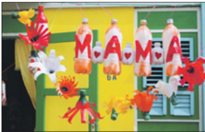
Deze keer is het thema moederdag.