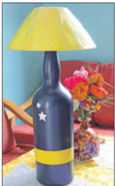
Een schemerlamp van een fles, op verzoek gemaakt.

Bij belangstelling voor de kunstwerken, die ook op verzoek en naar eigen idee gemaakt kunnen worden, is Ronald Langguth te bereiken op telefoonnummer 6650243.