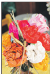
Van elk papiertje of prulletje op straat ontstaat er kunst, zoals dit kleurige bloemenboekje.

Slenterend door de wijk Carthagina in Otrobanda viel de fleurige decoratie aan een van de woonhuizen al van verre op. Dichterbij gekomen bleek het een feestslinger van gekleurde plastic flessen te zijn, ter ere aan een feestperiode die we net achter de rug hadden. De eigenaar van het woonhuis en z'n vrouw nodigden me binnen uit. Ik zag nog meer kunst, nuttige kunst, daarbinnen bij hen in de 'sala' (woonkamer), allemaal gemaakt van afvalmateriaal. Ik keek mijn ogen uit en stelde vragen. Toen kwamen de verhalen los.