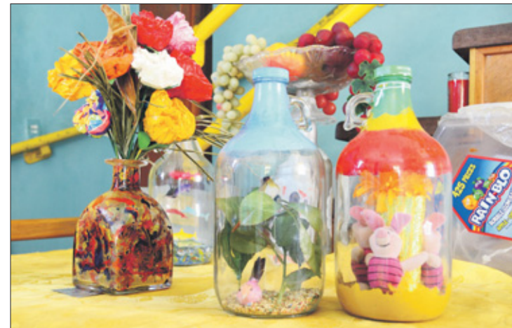
Verschillende binnenuit met verf bespoten en gevulde kunstige flessen.