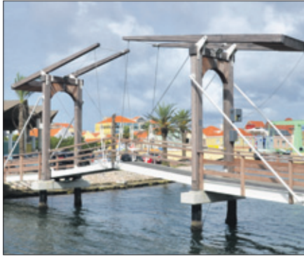
De Prinses Amalia-brug, die Scharloo met het Waagat in Punda verbindt.