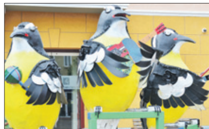
Plaza Jojo Correa, kunstwerk dat onlangs door de 100-jarige MCB is gedoneerd.