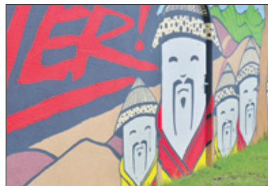
'Dikon chino' van Robert Rodrigues.