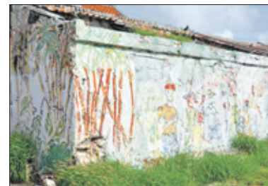
Door de jaren heen wat gebleekt, maar nog steeds mooi.