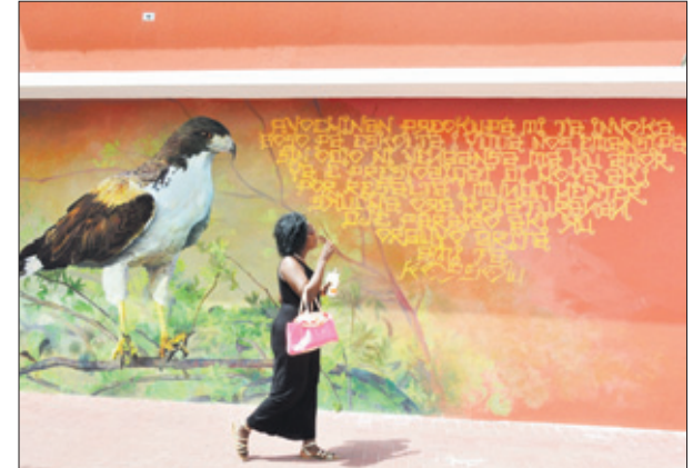
'Partawela', schildering van Garrick Marchena op de muur van het oude Alex-gebouw.