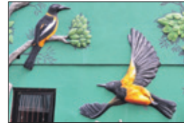
Vogeltafeel op het Keukenplein.

We lopen over het Goetzplein en weer een steegje in, waar de ateliers van Serena en Nena Sanchez gevestigd zijn. Allemaal kunst in het steegje, vrolijke kleuren en gezellighe chichi's (oudste zus in