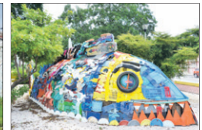
Kunst in het buurtpark van Scharloo.

A ls we zien wie zich allemaal verzamelen, is er over en weer geroept: moet je niet werken? De een heeft een vrije ochtend, de andere geniet van haar weekje vakantie en weer een ander is er vanwege de afwezigheid van de baas, met de telefoon in 'follow me'-stand. Een en al gelach, wat ons goed doet op de vroege ochtend. Het belooft gezellig te worden. We gaan zo veel mogelijk kunst opzoeken in Punda en eromheen.