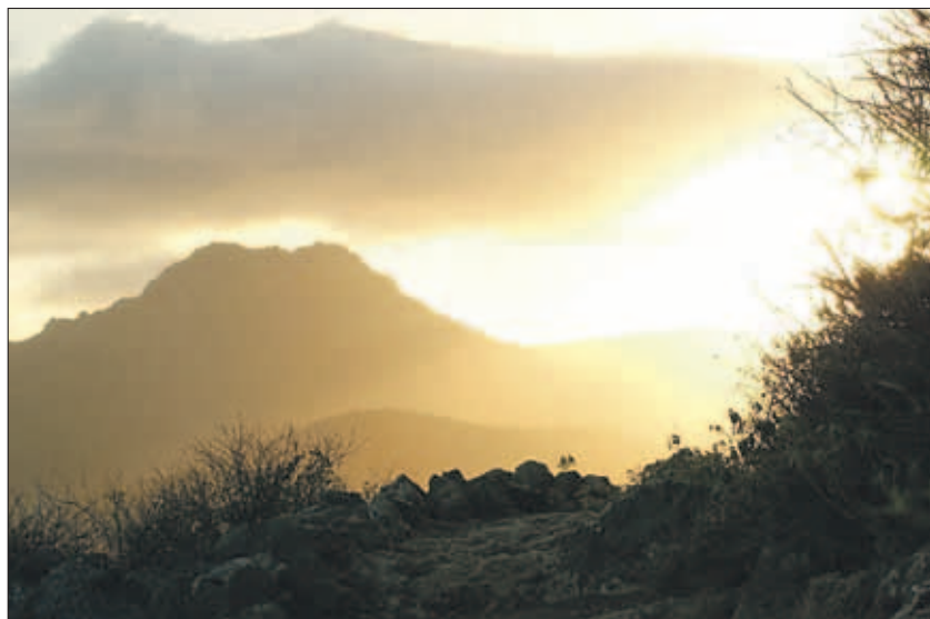
De eerste publicatie in 1955 was onder de naam Christoffel, naar de heilige patroon van de reizigers, maar ook vernoemd naar het hoogste punt van Curaçao, de Christoffelberg. „Onze hoogste berg staat symbool voor een nieuw tijdschrift Christoffel”, zo werd in de eerste publicatie aangegeven. De jonge redactie wilde toen aantonen met het tijdschrift het hoogst bereikbare te benaderen.