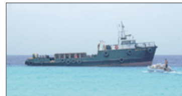
Volle dinghy's varen continu heen en leeg terug naar de barge.