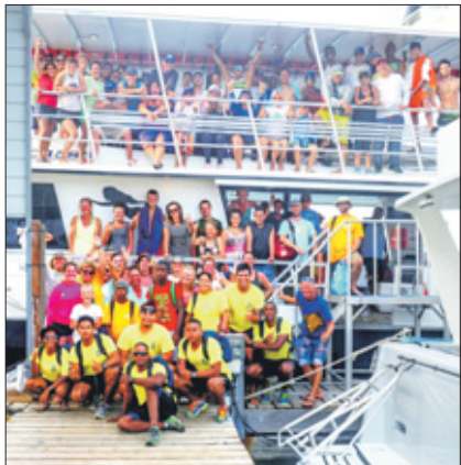
Alle deelnemers die deze clean up samen met de Curaçao SeaTurtle Conservation tot een groot succes hebben gemaakt.

Op de jaarlijks terugkerende Earth Day, op 22 april, is het de bedoeling om mensen te laten nadenken over hun consumenten-gedrag en wat de invloed hiervan is op de plek waar wij wonen en daarmee het effect op de hele aarde. In verband hiermee raapten vrijwilligers op een heilig, heet en bewoond Klein Curaçao ruim duizend zakken aan vuil bijeen. Het doel van de schoonmaak was tweeledig. Ten eerste is het belangrijk dat Klein Curaçao schoon is voor onder anderen de bezoekende toeristen, maar daarnaast is het belangrijk voor het nestseizoen van de zeeschildpad dat in mei begonnen is. Het succes van het nesten en van het uitkomen van de schildpadeieren (hatching) is verbonden aan een schoon strand.