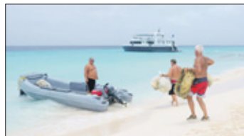
Het vuil wordt met de dinghy's naar de White Tip gebracht, die het verder naar Curaçao zal vervoeren.