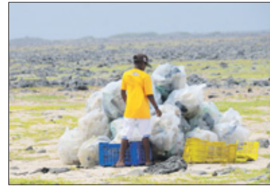
Op centrale plekken waar het opgehaald kon worden, werd het vuil bij elkaar verzameld.