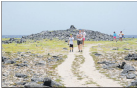
Om 12.30 uur even terug voor een korte lunch om weer kracht te verzamelen om verder te gaan. Daarna volgde een verfrissende duik in zee, wetende dat er ongeveer 1.000 plastic zakken aan vuil gevuld waren en afgevoerd zouden worden.