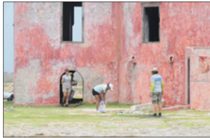
'Team Vuurtoren' verwijderde al het zwerfvuil, oude hekken en veel plastic binnen in de vuurtoren. Ook dakpannen zijn van de grond verwijderd, zo krijgt deze historische vuurtoren, die op restauratie wacht, weer een keurig aanzien.