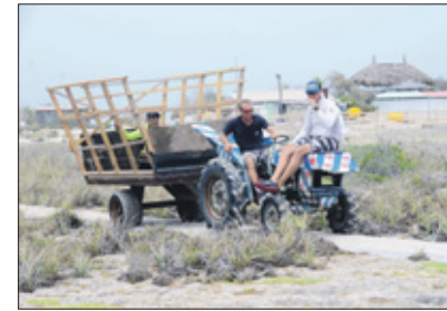
Deze creatieve uitspatting is door de jongens van de Mermaid gemaakt. Deze eigen gemaakte wagen kon gebruikt worden als bus, maar ook om de vuil op te halen voor transport naar het strand.