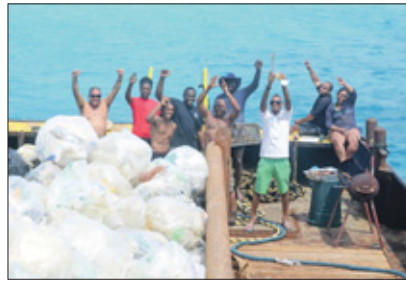
Op de White Tip wordt het vuil in de container verzameld. 'Pa un Kòrsò shushi of dushi', allebei zie je hier samen: 'dushi' op de bbq en 'shushi' in de container.