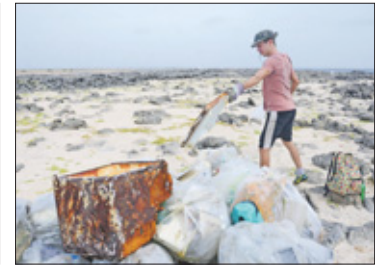
Koelboxen, maar ook plastic en alles wat man-made was, ontsnapt niet aan de verzamelwoede van de ruim 100 vrijwilligers.

De plastic flessen en meer, zoals bijvoorbeeld scheepstouwen, grote koelboxen die de vissers aan boord hebben voor hun vis, plastic vaten en stoelen, werden verzameld door de groep vrijwilligers van CCU, STCC, de kustwacht, stagiaires en het Venex/Totto Rescue-team.