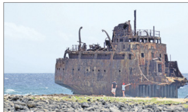
Door de jaren heen zijn er verschillende schepen gestrand, de resten van een enorme tanker zijn nog steeds te zien. Ook ligt de noordkant van het eiland bezaaid met kleine jachten.