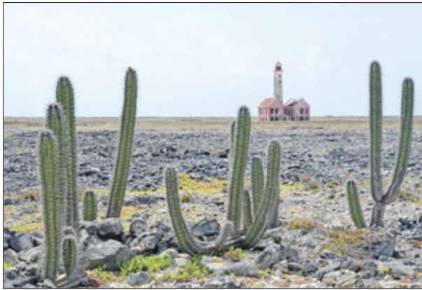
De enige cactussen op het eiland.

ABCourant NV Prof. Kernkampweg z/n Willemstad, Tel. 7472200