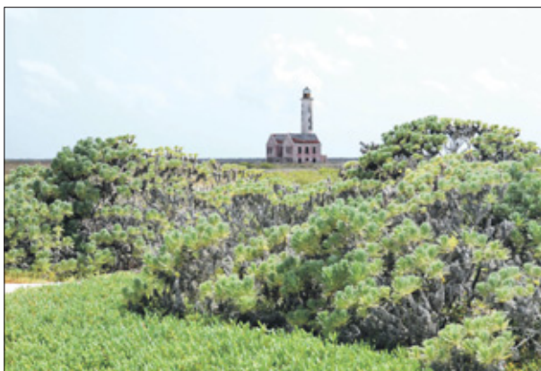
Diverse lage begroeiingen op het eiland.

lijk weer vlot getrokken. Er zijn ook andere vormen van exploitatie van het eiland geweest. De West-Indische Compagnie (WIC) heeft vele slaven vanuit Afrika naar Curaçao gebracht. Voordat deze slaven aan wal kwamen op Curaçao, werden de zieken eruit gehaald en op Klein Curaçao in quarantaine gezet. De overblijfselen van dit eerste quarantainegebouw zijn nog te vinden in het noordwesten van het eiland. De slaven en andere passagiers die de zeereis niet overleefden, werden op Klein Curaçao begraven. Er zijn graven gevonden in het