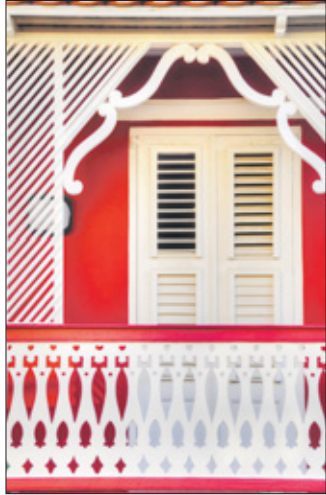
Laat het wonder van de kerst uw huis verwarmen.