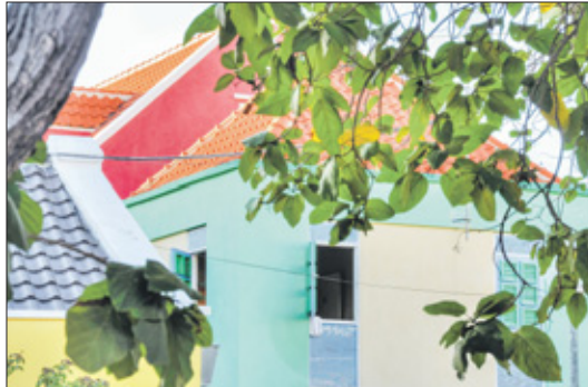
Dat Kerstmis gevuld mag zijn met warmte en liefde.