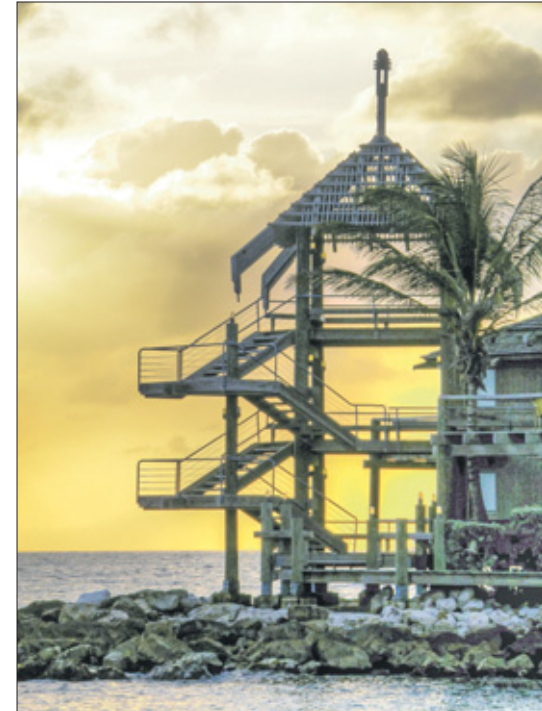
Lichtjesfeest: dat is kerst het allermeest.