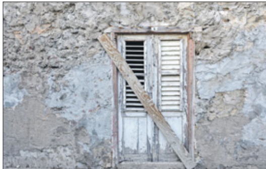
Wij wensen voor alle mensen een vervulling van stille wensen.