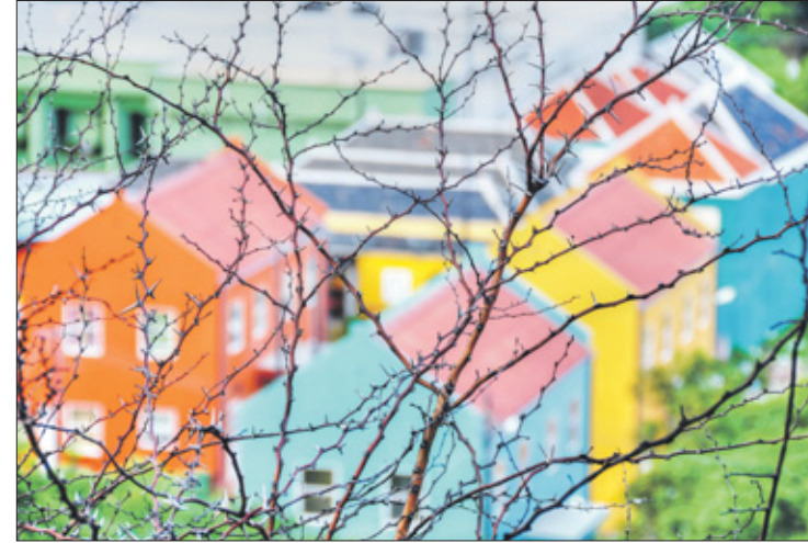
Laat de liefde sprankelen, knetteren en knallen met de jaarwisseling.