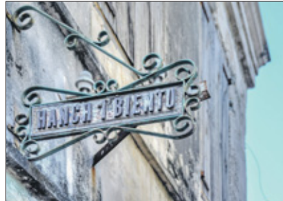
Je hele lange leven met je voetjes op de grond. Beetje dromen, beetje zweven lijkt ons ook niet ongezond.