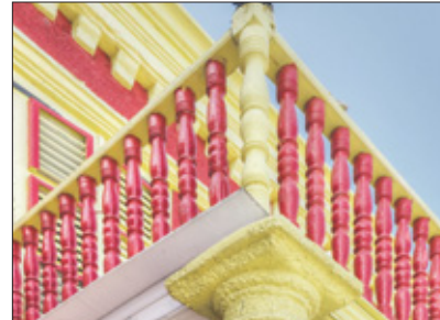
Sluit uw ogen en doe een wens. Alvast even wegdromen over wat er in het nieuwe jaar gaat komen.