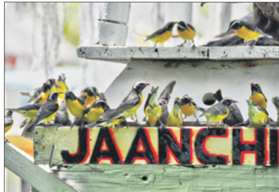
Bewaar wat fijn is. Of het nu groot of klein is. Hou vast wat raakt. Laat los wat niet gelukkig maakt.