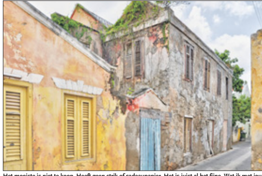
Het mooiste is niet te koop. Heeft geen strik of cadeaupapier. Het is juist al het fijne. Wat ik met jou samen vier.