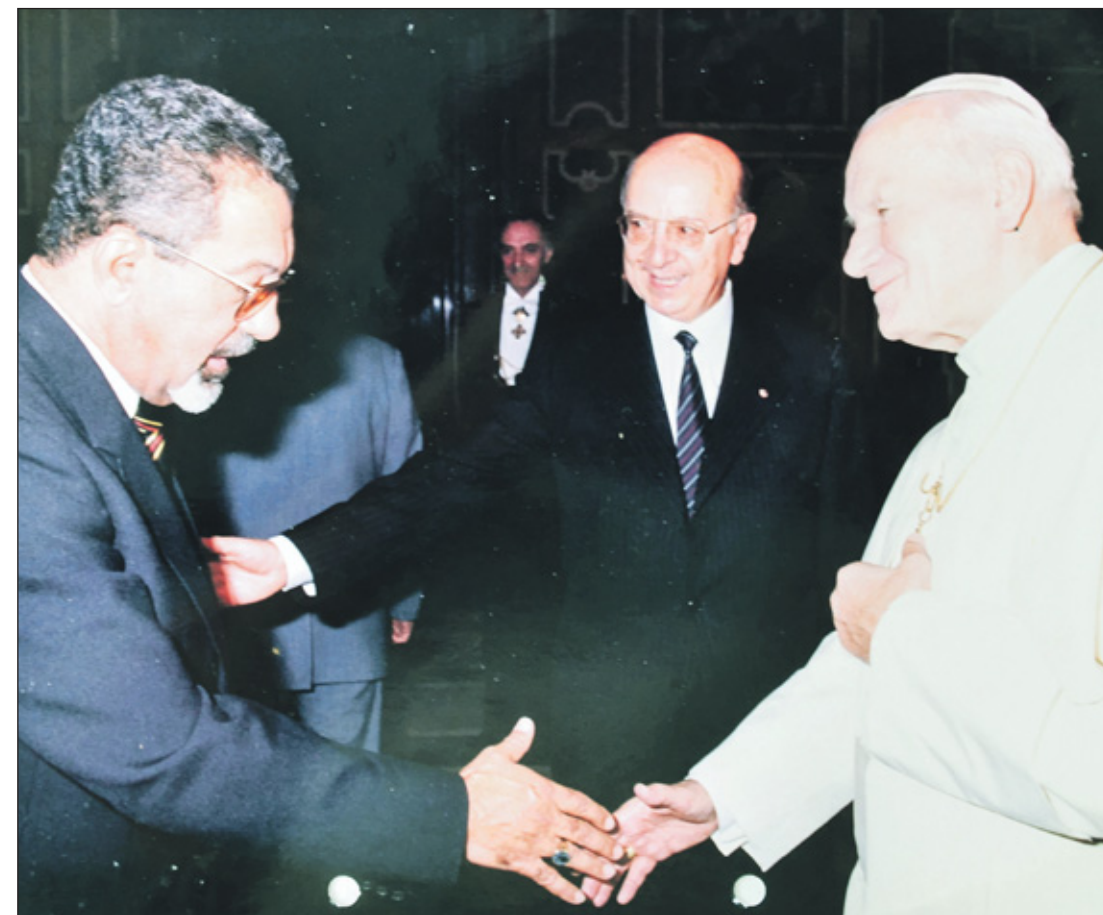
Een ontmoeting met de paus.