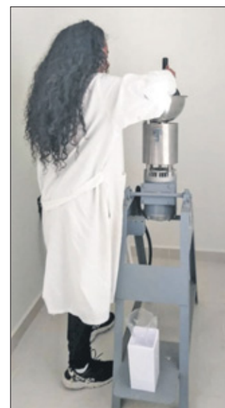
De stukjes bot worden tot as vermalen.