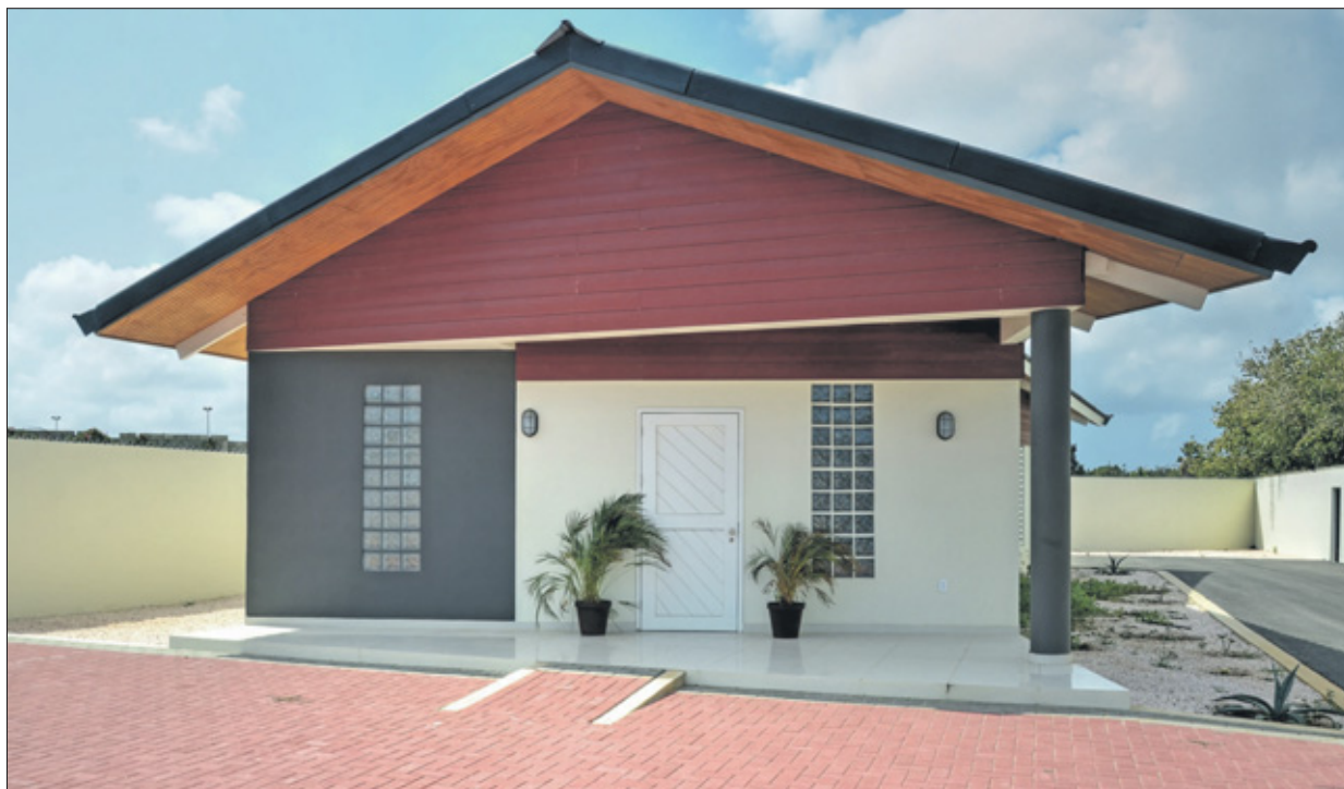
Het huisdierencrematorium te Brievengat.

ABCourant NV Scharloeweg 31 Willemstad, Tel. 7472200