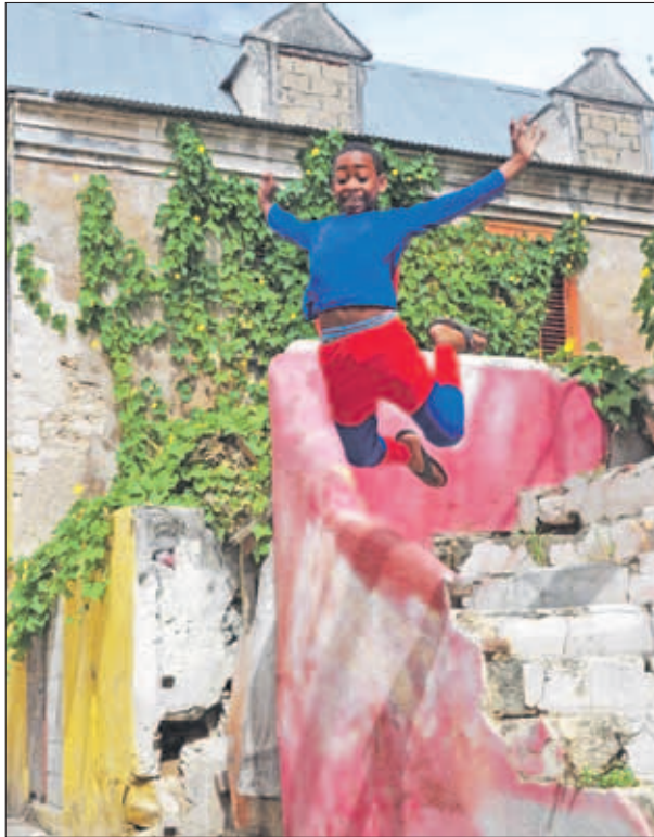
Ons model van de dag: een jongetje uit de buurt als flying Superman.

Verder heb ik ook veel tijd gestoken in het opzetten en leiden van een online fotoclub en het organiseren van allerlei activiteiten op fotografisch gebied. De tijd is nu aangebroken om me meer op het maken van foto's te gaan concentreren, en ik weet welhaast zeker dat Click Curacao mij daar de kans toe geeft."