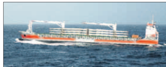
Een A-type schip tijdens het lossen van bulkcargo.