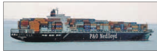
'P&O Nedlloyd Rotterdam', container schip (gt. 80942 ton) onder de Nederlandse vlag, met lengte (m): 299, breedte (m): 42, diepgang (m): 11,50, snelheid (kn): 21,5.

Dorothea werd aangenomen en haar allereerste reis geschiedde in de functie van tweede machinist, in de machinekamer, waar de machinekamerapparatuur uit elkaar wordt gehaald. De taak van de tweede machinist is onderhoud aan de machines en alles wat niet goed loopt weer normaal te laten werken.