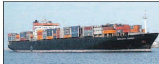
'P&O Nedlloyd Europa', container schip (gt. 48508 ton) van het type tandenborstelschip, onder de Nederlandse vlag met een lengte (m): 266,30, breedte (m): 32,30, diepgang (m): 12,50, snelheid (kn): 23,5.