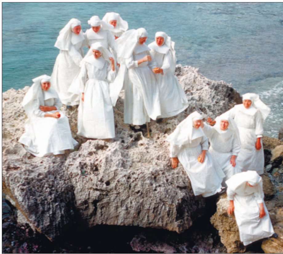
Zusters van Breda en van het Hospitaal op de rots 'Piedra di Wewe'.