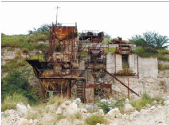
De restanten van de grote steenbrekerij op een heuvel. De grotere stenen werden gebracht naar een kleinere 'crusher' om te verwerken tot kiezels en tot slot tot zand.