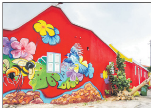
Prachtig beschilderd wooncomplex op Berg Altena.

joodse begraafplaats op Berg Altena is ook nieuw voor mij. Ik ga links van de begraafplaats de weg omhoog en nog voor de stoplichten op Berg Arrarat naar rechts de wijk in. Ik dacht altijd dat het slechts een doodlopende straat betrof, gezien vanuit mijn auto wanneer ik daar bij de stoplichten op Berg Arrarat stond te wachten totdat die groen zouden worden. De wijk ziet er keurig uit, door de bewoners onderhouden en met zelfs een buurtraad, wordt verteld. Binnenin een pleintje, met speeltoestellen voor de kinderen. Er staan bankjes langs, waar volwassenen in de middag- en avonden gezellig keuvelend de kleintjes in de gaten kunnen houden. Er staan enkele huizen om het pleintje heen. Bewoners met duidelijk