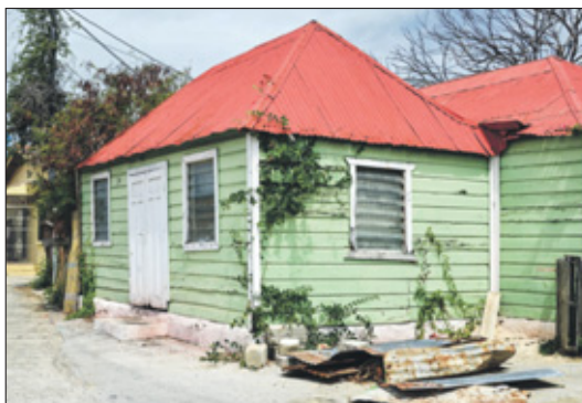
De wijk in.