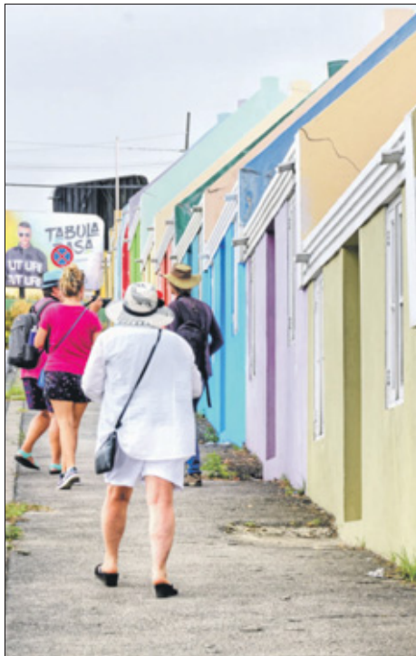
Op Berg Altena bij de rijtjeshuizen omhoog, om daarachter de wijk in te gaan.