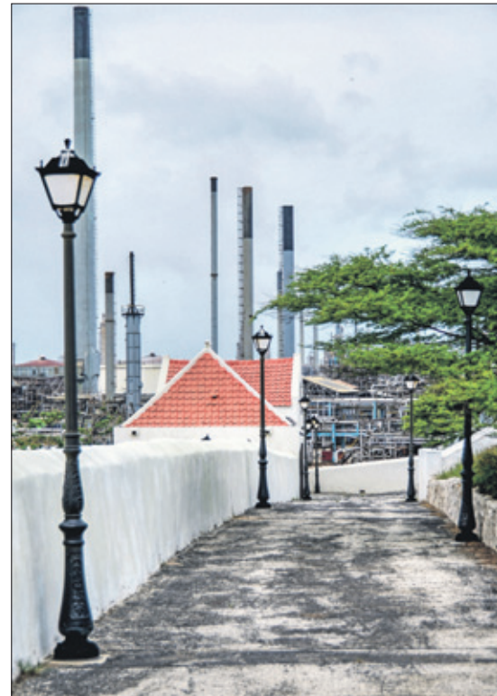
De officiële entree.

maar alweer een aantal jaren niet, de joodse begraafplaats Beth Haim, Huis van de Levenden, pal onder de rook van de Isla. Het 17e eeuwse Beth Haim is in vergelijking een klein stukje grond, omringd door het immense terrein van de Isla-olie-raffinaderij, dat zich daar sinds 1915 heeft gevestigd en het 'Huis van de Levenden' langzaam heeft ingesloten. De plek beslaat ruim twee hectare, ligt er al sinds 1658 en is de oudste joodse begraafplaats van het Caribisch gebied. Het moet in de 17e eeuw een rustieke plaats zijn geweest, met zicht op het Schottegat, de binnenhaven van Curaçao, het hart van de handel. Het vertelt de geschiedenis van de joodse diaspora. De grafzerken lagen oorspronkelijk vlak en gelijk met de grond, maar in de loop der tijd werden ze overdekt door aarde en losse stenen en