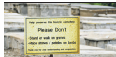
Het wordt beschouwd als een vorm van respectloosheid ten aanzien van de overledenen om over een graf te lopen of erop te staan. Als men een grafsteen nader wil bekijken, benadert men deze van de zijkant.