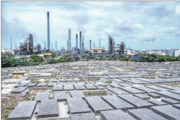
De joodse begraafplaats van Beth Haim Blenheim, 'Huis van de Levenden', pal onder de rook van de Isla.

ABCourant NV Scharlooweg 31 Willemstad, Tel. 7472200