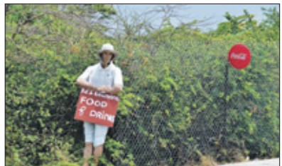
Lokkertje langs de weg.

Een ritje Bándabou op de zondagochtend is een van m'n favoriete routes, dat altijd weer verrassend uitpakt. Samen met een vriendin, die dezelfde hobby als ik, fotografie, heeft ga ik op pad. We beginnen gewoon ergens en komen er al rijdend achter waar onze belangstelling op dat moment naar uit gaat. Het verkeer is op de zondagmorgen minder druk en hoe verder je komt, hoe stiller de weg wordt. We beginnen in de buurt van vliegveld Hato.