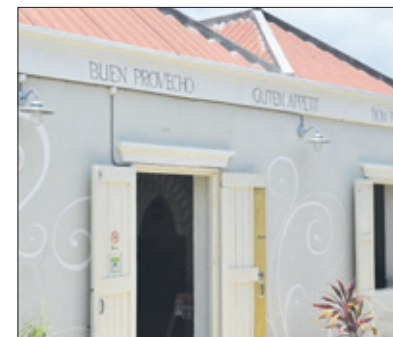
Bistro e Lanternu, schuin tegenover de afslag naar Cas Abou.