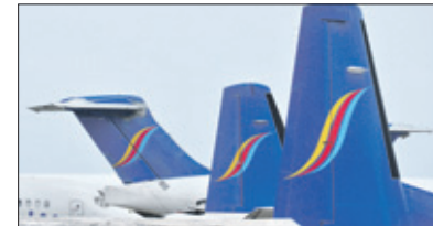
Een deel van Insel Air's vloot.