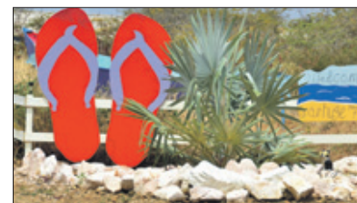
Grote slippers in felle kleuren trekken de aandacht.