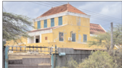
Landhuis Hermanus, langs de weg van Willibrordus.