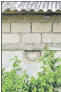
Gebouwen rotten weg.