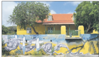
Het landhuis waar Curaçao Winery in gevestigd was.