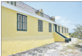
Landhuis San Juan met details van de zijkant van het huis, de voorkant en de statige entree.