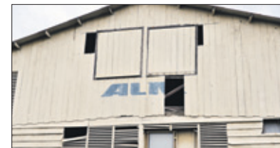
De naam ALM staat nog op het gebouw.