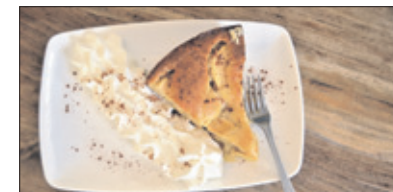
Appeltaart met slagroom.