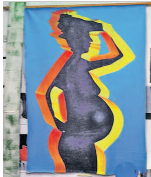
Het schilderij van de zwangere vrouw heeft als titel 'Hoop'. In de maak zijn nog: een oude vrouw, die 'Ervaring en Kennis' moet uitbeelden; een 'Geëmancipeerde vrouw' en een 'Vrouw' die het gemaakt heeft.

van de kunst niet kent. De concepten worden door elkaar gebruikt en raken in de war. Ik heb om die reden dus besloten geen kunstwerken meer te doneren. Maar daarmee trap je op de gevoelige tenen, want de mensen denken daar vaak anders over. De gouverneur hield een nieuwjaarsborrel met een speech en zei dat kunstenaars onderbetaald zijn. Hij geeft dat dus zelf aan, maar wanneer komt er eindelijk een kunstbeleid om alles in orde te maken en op te stellen? Wie zijn de kunstenaars die naar Curaçao komen om te exposeren, wanneer krijgen wij een kans ergens naartoe te gaan? Niemand geeft ons die kans, we moeten altijd over het water of via de lucht en kunnen niet gezamenlijk een contai-